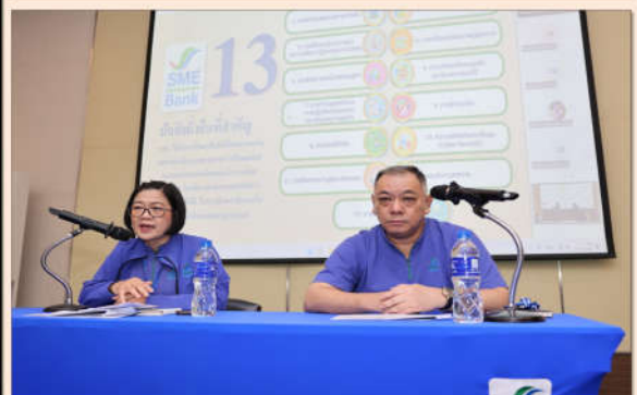
พบเห็นการทุจริต แจ้งเบาะแสได้ที่ : ฝ่ายป้องกันการทุจริตและส่งเสริมธรรมาภิบาล ชั้น 28 อาคาร SME BANK TOWER

Outlook : ฝ่ายป้องกันการทุจริตและส่งเสริมธรรมาภิบาล E-mail : Acsme@smebank.co.th หรือ โทร : 4070 4067 และ 4069